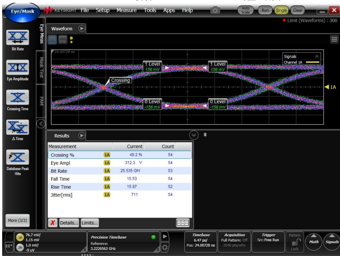
BERTWave E225A 设备 25.78125G、PRBS31 码型 眼图